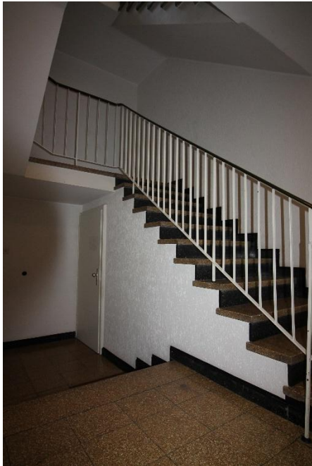
Eingangsbereich im EG